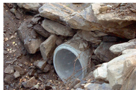
Pose de nouvelles canalisations